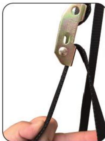
4. Vytáhněte popruh na druhém konci očka.