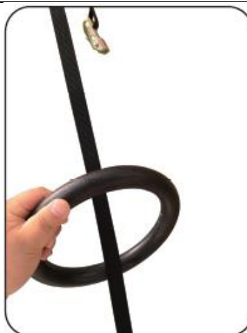
2. Provedlechte kruhy.