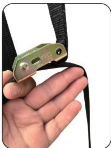
3. Provedlechte popruh očkem a táhněte jej ve směru šipky.