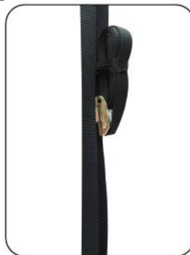
6. Srolovanou část popruhu zabezpečte páskou.