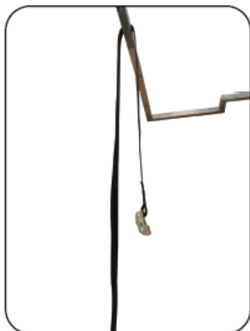
1. Pověste popruhu na nosník.