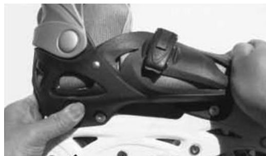
Potlačení špičky (stisknutí tlačítka)