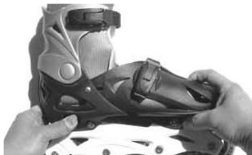
Potažení špičky (stisknutí tlačítka)